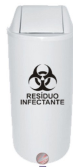
CESTO PARA LIXO INFECTANTE