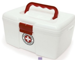
CAIXA PRIMEIROS SOCORROS