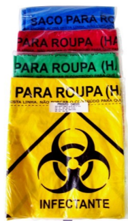
SACO PARA HAMPER