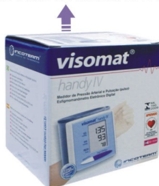
MEDIDOR DE PRESSÃO DIGITAL