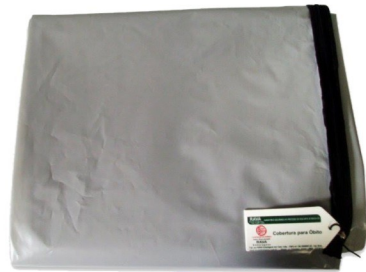
SACO DE ÓBITO