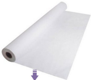
LENÇOL DE PAPEL