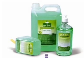
ÁLCOOL GEL 70%