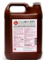
HIPOCLORITO DE SÓDIO 1%